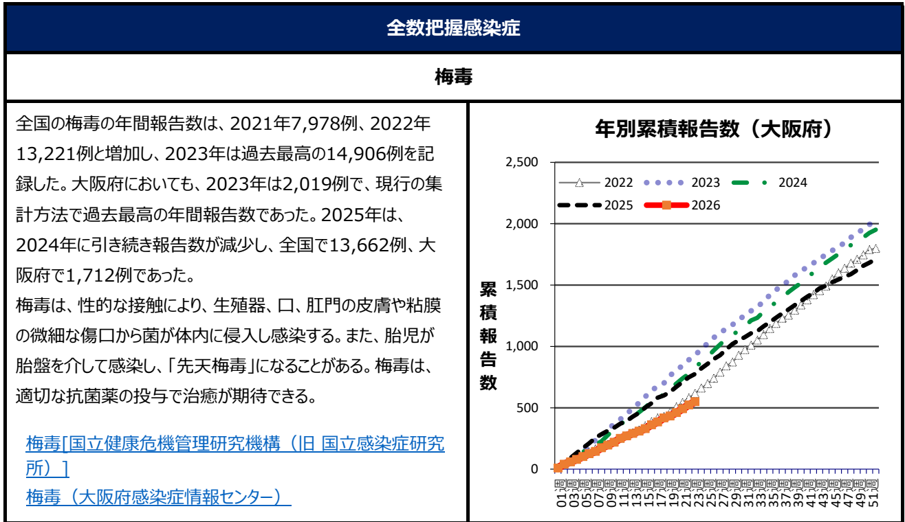
表2. 大阪府全数報告数(2026年 第23週6月1日～6月7日)

注意：この週報は速報性を重視しておりますので、今後の調査に応じて若干の変更が生じることがあります (報告があった疾患のみ記載しています。詳細は感染症情報センターホームページ>【週報】>全数把握疾患 をご覧ください。)